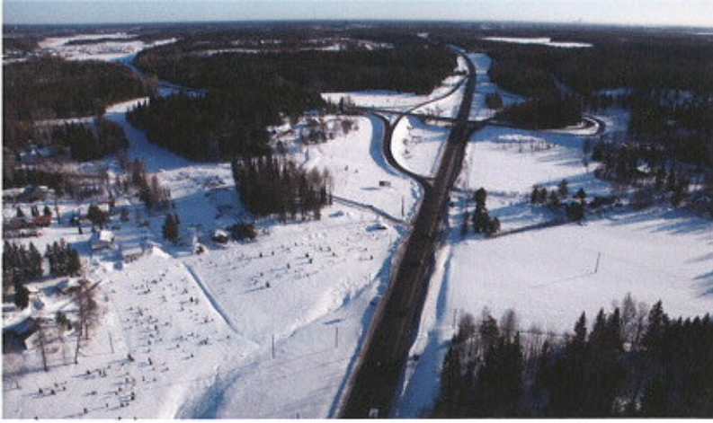
Myös Kehä III:n liittymää parannetaan.