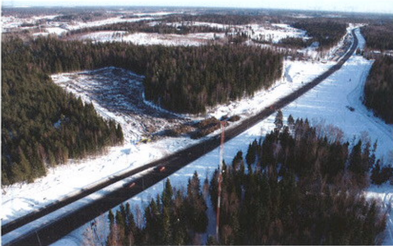
Parannushanke on aloitettu mm. maansiirtotöitä tekemällä.