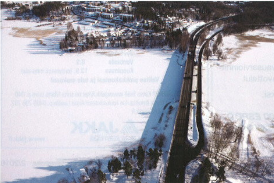
Hankkeen myötä myös tien siltoja parannetaan. Kuvassa Espoonlahden silta.

Nyt käynnissä ovat paalulaatan rakennustyöt Jorvaksen eritasoliittymän itäpuolella, samoin kuin Kehä III:n ny-