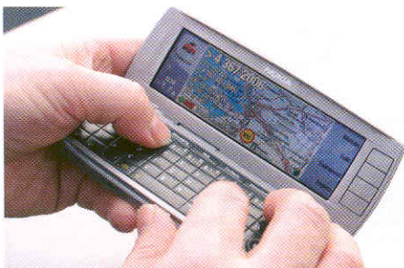
Mobiilisuus muodostaa merkittävän mahdollisuuden palvelusopimusten toimintamallin kehittämisessä.

Tiedon hallinta jopa 3-ulotteisena muodostaa mahdollistavan tekijän palvelusopimuksissa. Ilman hyvää olemassa olevien rakenteiden ja niiden tilan tiedon hallintaa joudutaan sopimuksissa jättämään paljon avoimeksi ja luottamus pohjalle. Tieto rakenteista, niiden kunnosta ja kunnan kehittymisestä on yksi sopimusasiakirja. Infra2010 – työ-