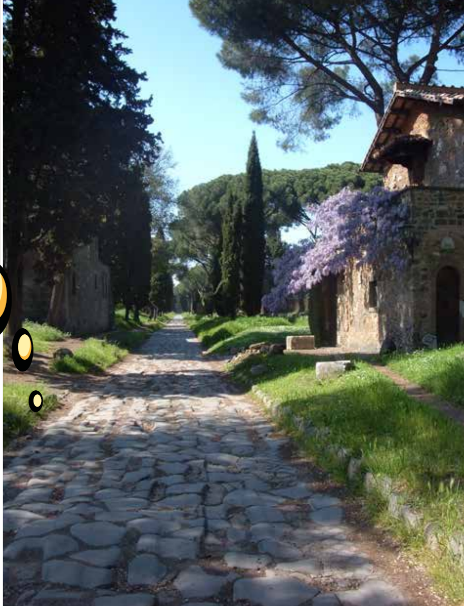
Via Appia, rakennettu 300-luvulla eaa.

ROOMALAISET VIAT OLIVAT PARHAIMMILLAAN MUUTAMAN METRIN LEVEITÄ, KIVELLÄ PÄÄLLYSTETTYJÄ TEITÄ OJINEEN, KALLISTUKSINEEN JA PIENTAREINEEN.