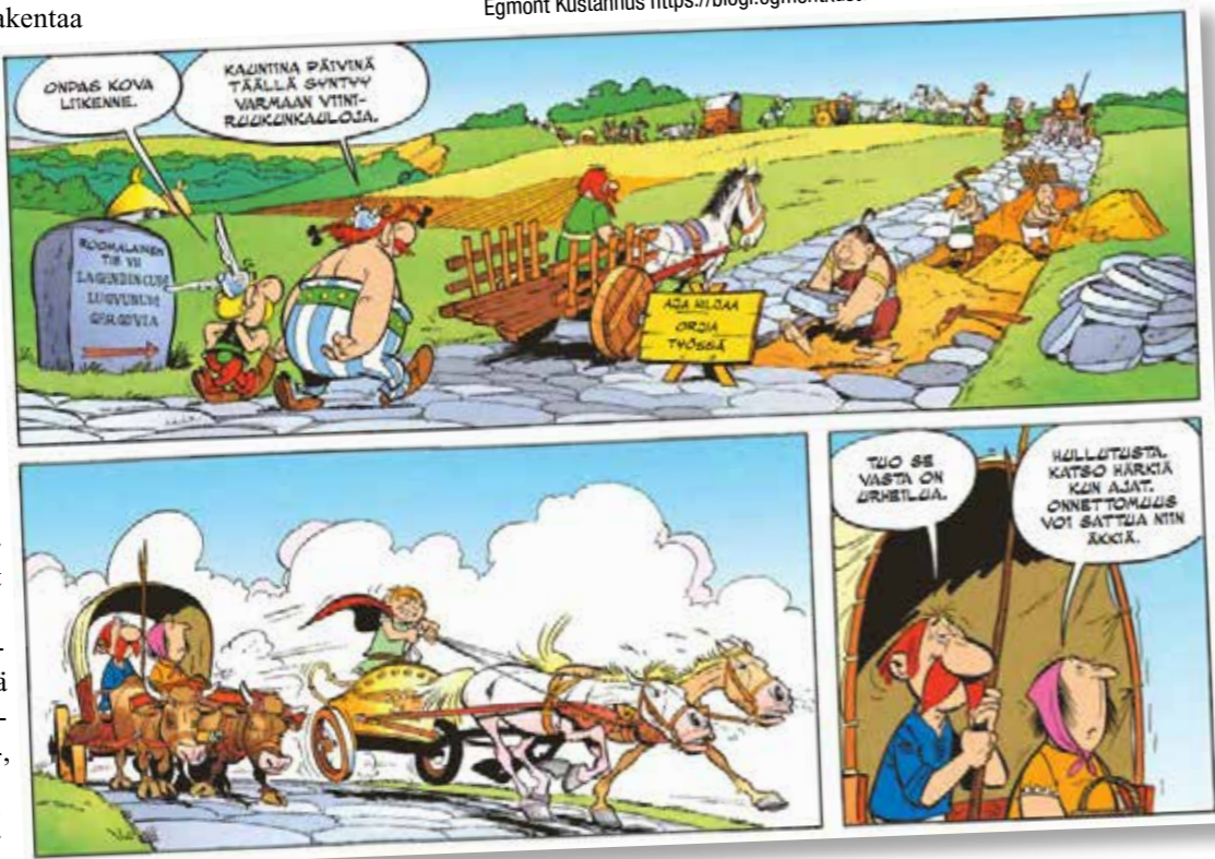
Egmont Kustannus https://blogi.egmontkustannus.fi/category/lahjavinkki/page/6/

ROOMALAISET VIAT OLIVAT PARHAIMMILLAAN MUUTAMAN METRIN LEVEITÄ, KIVELLÄ PÄÄLLYSTETTYJÄ TEITÄ OJINEEN, KALLISTUKSINEEN JA PIENTAREINEEN.