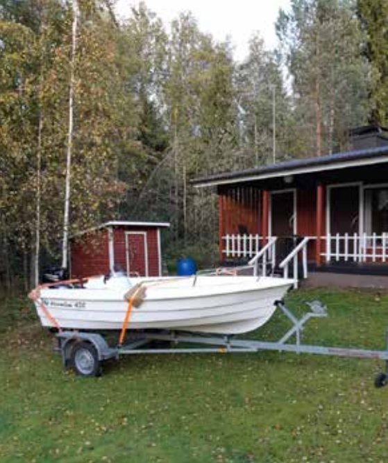
Kesällä lomapaikka löytyy Suomen-joelta jossa on hyvä kalastella.